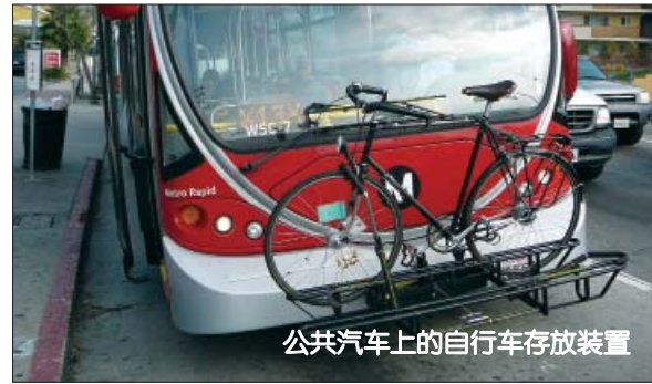
公共汽车上的自行车存放装置

Alta 在世界范围内率先研究行人及自行车，经验丰富，因此成为创造更多便于行走及骑自行车的社区的先驱。我公司的交通规划人员、设计人员及工程师可多方面为您提供服务，如自行车和行人的蓝图、安全及盲点的研究、联运走廊、街景画、交通减速、上学安全路径设计图、移动规划、自动寻路、道路设计、自行车在公共汽车上的存放装置，以及自行车存放处的评估。我公司已规划设计了上万公里的通道和自行车专用路，提供了高效安全的交通，提供了风景美丽的娱乐休闲场所，创造了外观喜人的公共场合，促进了各个年龄层人的移动性，从而连接各社区，可持续发展，并为居民极大地提高了生活质量。