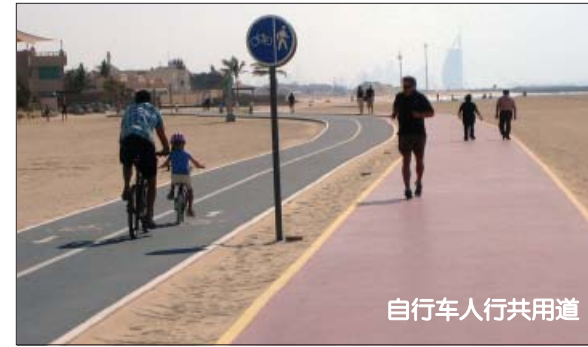
自行车人行共用道