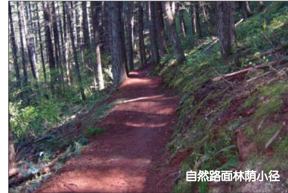
自然路面林荫小径